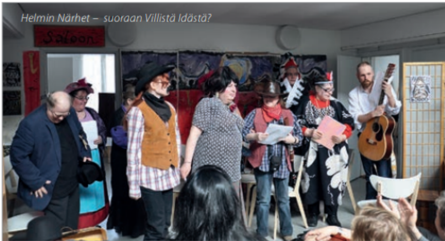
Helmin Närhet – suoraan Villistä Idästä?