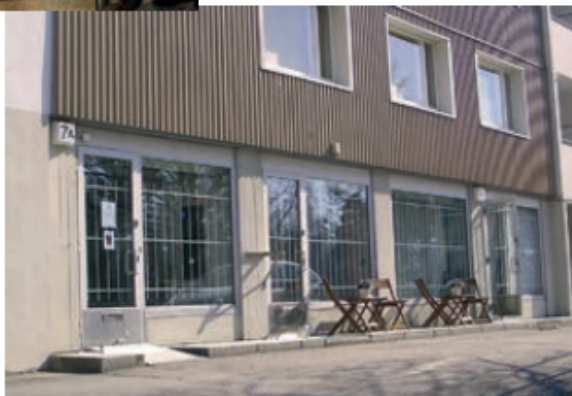
Siilitien jäsentalon ikkunoita >