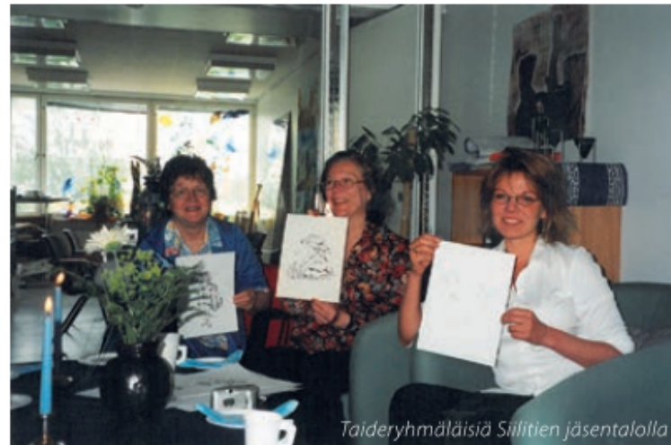
Taideryhmäläisiä Siilitien jäsentalolla

– Olin ihan lapsesta saakka piirtänyt, joten tuntui luontevalta mennä taideryhmiin. Niissä olen vieläkin ja vedän itsekin. Se minut nappasi mukaan. Ja ihmiset ottivat tulijan kauhean hyvin vastaan. >>