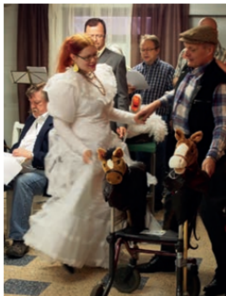
< Kulkurin valssi