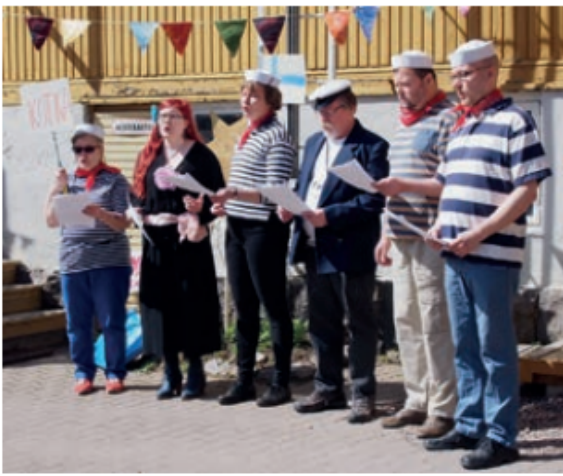
Helmin Närhet Pasilan Helmi-talolla 2016.