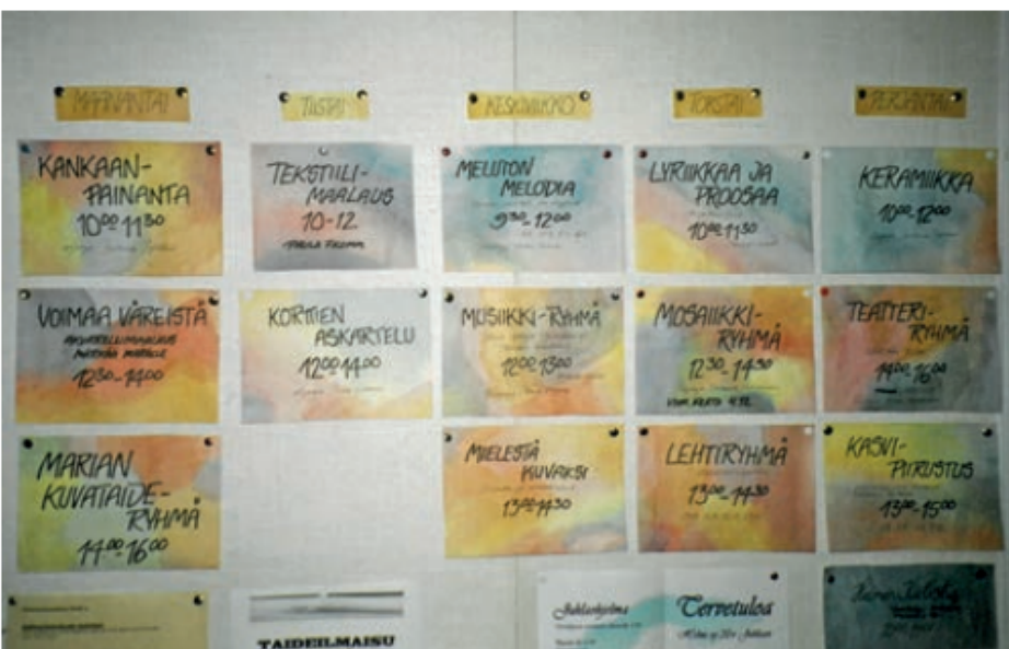
Helmin viikko-ohjelma 2003.

mistä ja minkälaisia tämän tyyppiseen toimintaan hyviä tiloja olisi saatavilla.