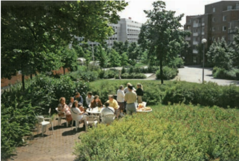
Pasilan Helmi-talon pihalla.