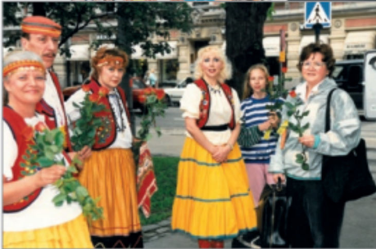
Iloa yhdessä -tapahtuma Espalla 1989.