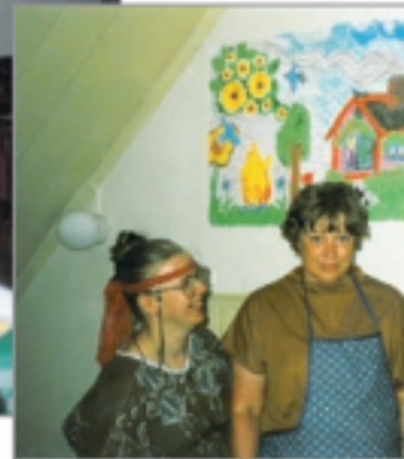
Päiväryhmän luova hetki 1986.