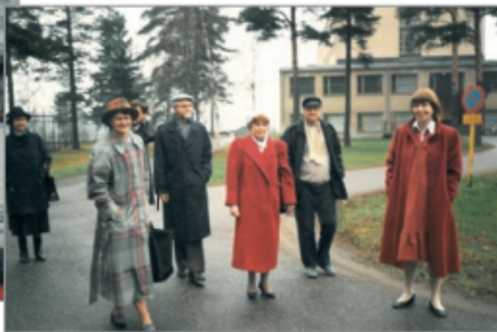
Vierailulla Nikkilässä 1987.